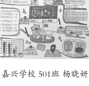
嘉兴学校 501班 杨晓妍