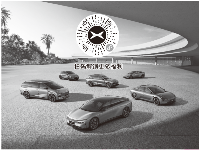
扫码解锁更多福利

12月10日小鹏P7+续航能耗OTA全量推送，续航最高增加15公里！XOS 5.4.5续航OTA也实现全量推送续航升级，让更多鹏友的出行