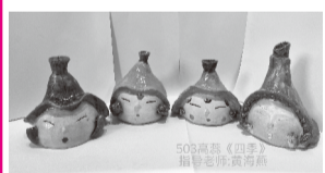
503班 高蕊《四季》 指导老师：黄海燕